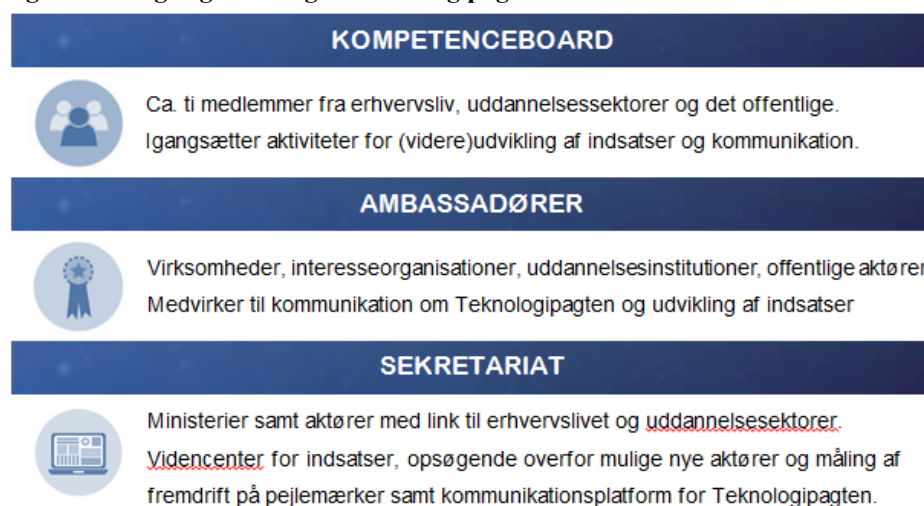
Figur 2. Mulig organisering af Teknologipagten

Endelig overvejes det, at regeringen årligt samler deltagerne i Teknologipagten for at sætte fokus på kompetencebehovet og Teknologipagten's initiativer og fremdrift. Mødet ville samtidig kunne opretholde dialogen med regeringen i samarbejdet om at udvikle kompetencer til et mere teknologisk og digitalt erhvervsliv.